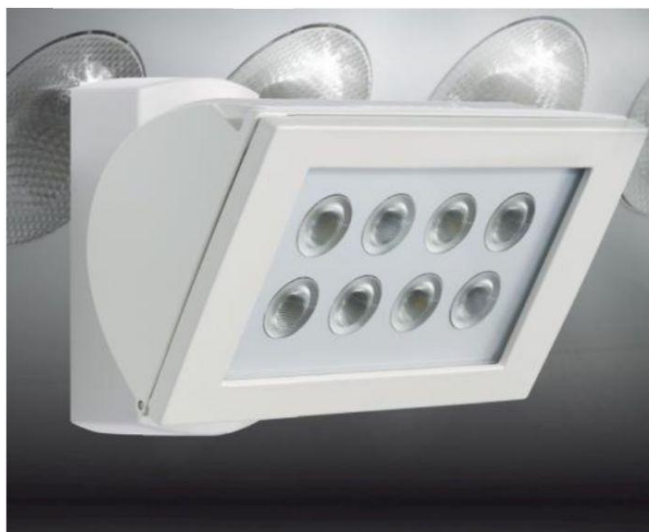
Rysunek 1. Osprzęt oświetleniowy LED w instalacji zewnętrznej.

Bardziej kreatywni użytkownicy zwrócą uwagę na listwy LED. Są to stosunkowo elastyczne, giętkie, zwinięte i niewielkie taśmy z diodami LED. Można odciąć wymaganą długość i podłączyć przewód zasilający. Listwy LED mogą stanowić źródło światła pośredniego w pomieszczeniach i witrynach; ich zastosowanie jest też wyjątkowo popularnym sposobem na bezpieczne oświetlenie klatki schodowej.