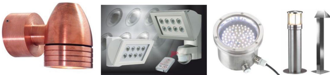
Rysunek 2. Oprawa ścienna typu downlight, projektor iluminacyjny LED, punkt oświetleniowy LED wpuszczany w ziemię i słupki oświetleniowe. (Źródło ilustracji: PSM oraz Esylux).

Wśród opcji oświetlenia ogrodowego można znaleźć nawet niewielkie produkty z własnym panelem słonecznym. Jednak wiele z nich zapewnia stosunkowo słabą jasność oświetlenia i działa przez krótki czas, co stanowi poważny problem zimą. W pochmurne dni zimowe baterie nie ładują się całkowicie, więc szybko się wyczerpują i światło gaśnie. Opadające liście i padający śnieg również mogą zakłócić ładowanie. Z tego względu zalecamy uzupełnienie oświetlenia ogrodowego o osprzęt przewodowy - oznacza to jednak uwzględnienie odpowiednich kabli lub rur instalacyjnych na etapie projektowania systemu.