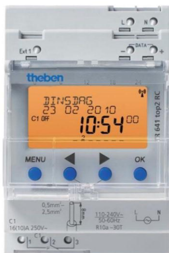
Rysunek 5: Przykład programatora czasowego z funkcją zegara astronomicznego.

Programatory czasowe umożliwiają automatyczne włączanie i wyłączenie określonych obwodów oświetleniowych o wybranych porach. Czas uruchomienia i zatrzymania można konfigurować. Do automatycznego sterowania oświetleniem ogrodowym najlepiej użyć programatora czasowego z funkcją zegara astronomicznego, ponieważ słońce zachodzi wcześniej i wschodzi później zimą niż latem. Stałe ustawienia czasowe nie zdają tu egzaminu. Funkcja zegara astronomicznego działa w oparciu o wewnętrzny kalendarz z podanymi porami wschodów i zachodów słońca, który konfiguruje się z uwzględnieniem rejonu, w którym jest instalowany.