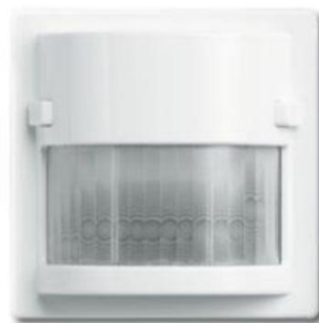
Rysunek 4. Zewnętrzne czujniki ruchu to częsty widok. Istnieją jednak również wersje do stosowania wewnątrz, które pomagają zapewnić mieszkańcom większy poziom bezpieczeństwa i wygodę.

Podczas instalacji czujników ruchu należy starannie dobrać ich lokalizację, aby były użyteczne. Pole wykrywania dzieli się na kilka sąsiadujących ze sobą sektorów. Aby czujnik się uaktywnił i spowodował włączenie światła, ruch musi zostać wykryty w kilku sąsiednich sektorach. Oznacza to, że czujniki ruchu powinny być zwrócone w poprzek trasy, a nie bezpośrednio na wprost.